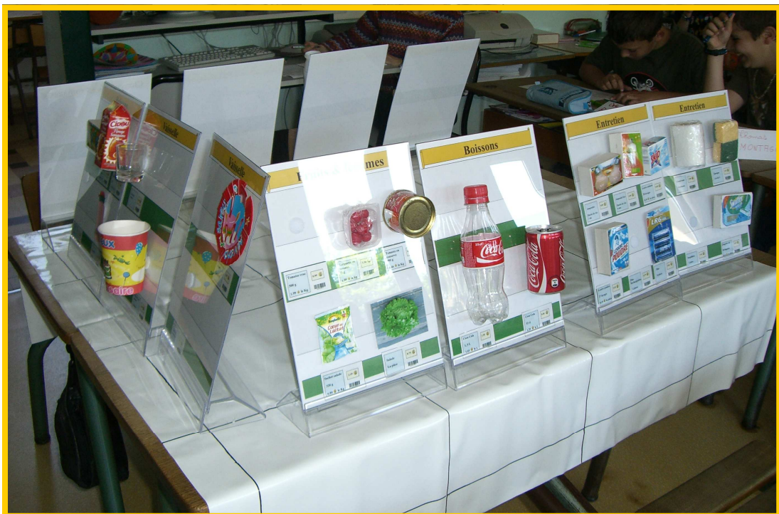
Jeu pédagogique sur le thème de la réduction des déchets, conçu par APIEU Mille Feuilles.