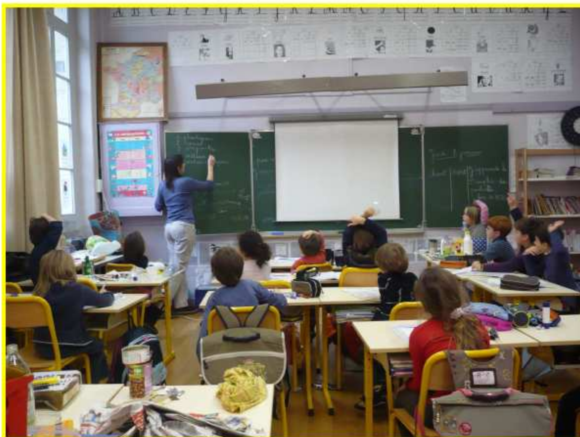
Ecole Pierre Corneille, Lyon 6ème, Janvier 2010