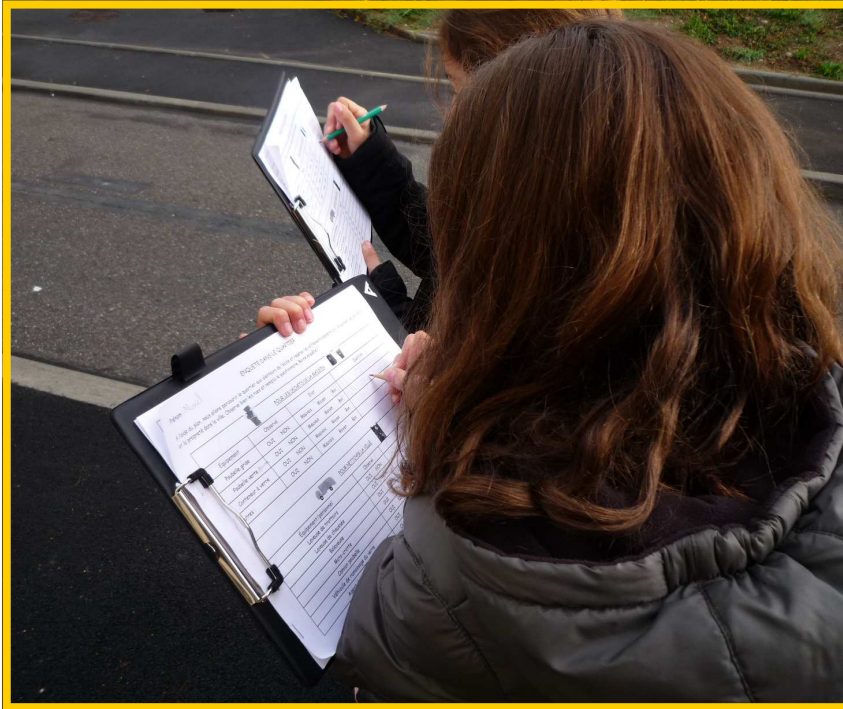
Ecole Les Géraniums, Feyzin, Octobre 2009.